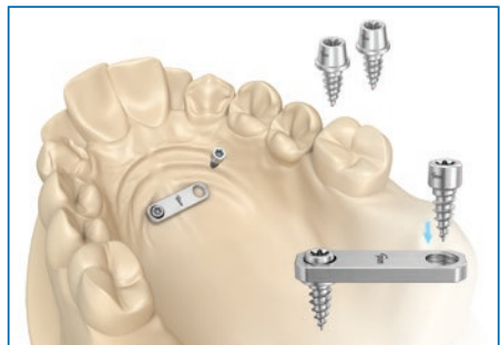
Appliance preparation with laboratory pins Apparaturherstellung mit Labor-Pins

Please ask for our product information KAT-034 | Bitte fordern Sie unsere Produktinfo KAT-034 an