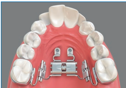
Hybrid Hyrax® Distalizer